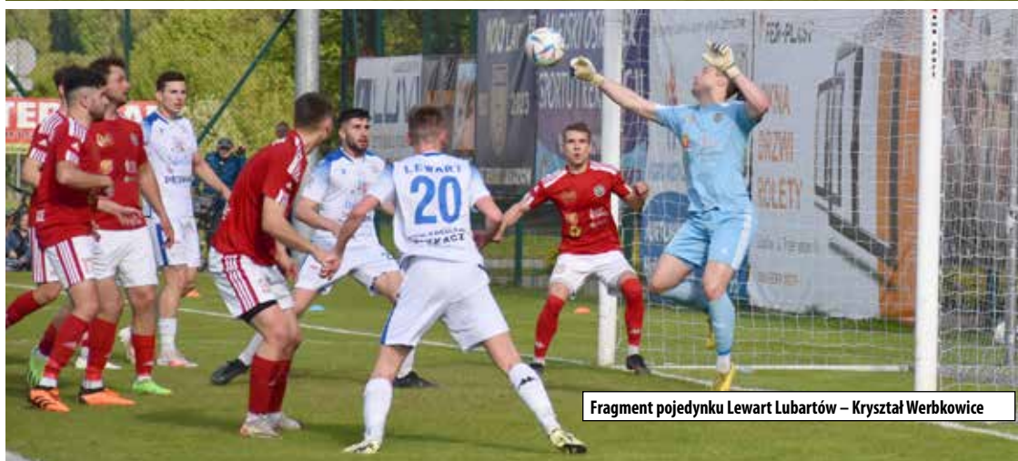
Fragment pojedynku Lewart Lubartów – Kryształ Werbkowice