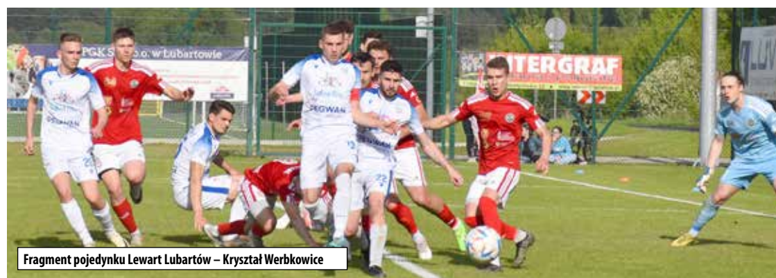
Fragment pojedynku Lewart Lubartów – Kryształ Werbkowice

tem z pracy zrezygnował cały sztab szkoleniowy Cisowianki. Gdy „biało-niebiescy” dojechali na miejsce,