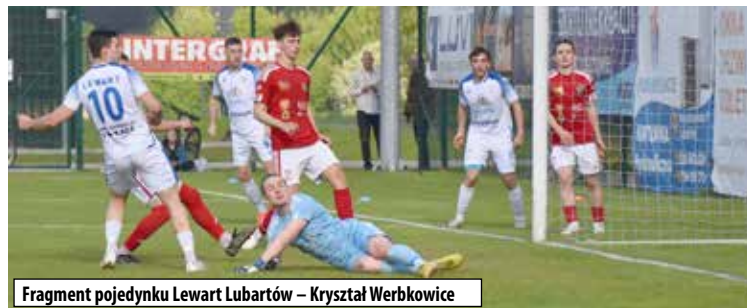
Fragment pojedynku Lewart Lubartów – Kryształ Werbkowice

rzut karny. Został on zamieniony na bramkę i końcowy wynik spotkania Lewart – Kryształ to 4:2.