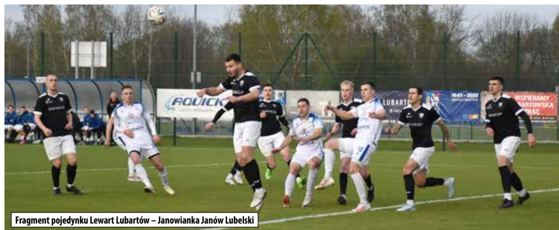
Fragmenc meczu Lewart Lubartów – Janowianka Janów Lubelski