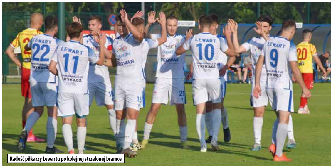
Radość piłkarzy Lewartu po kolejnej strzelonej bramce