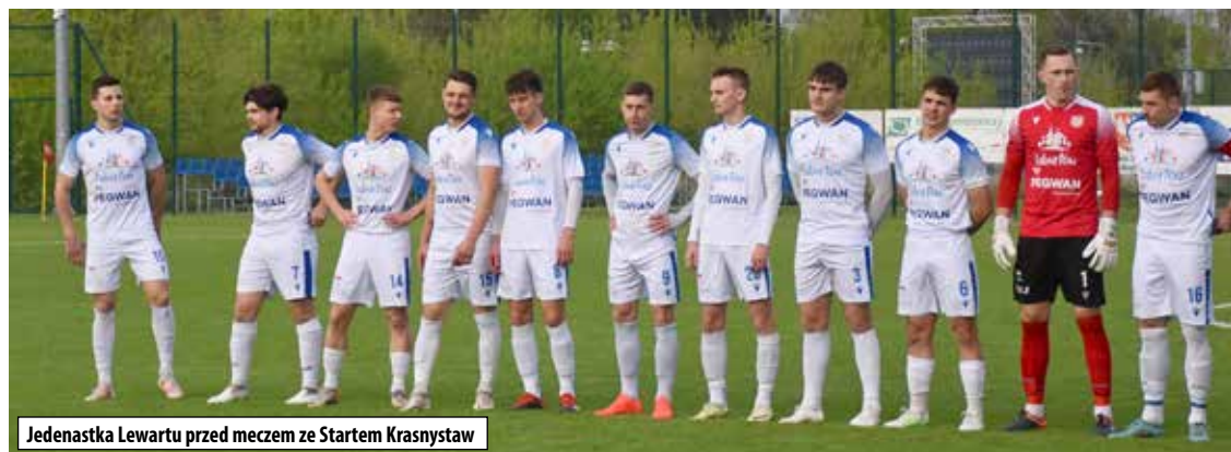
Jedenastka Lewartu przed meczem ze Startem Krasnystaw