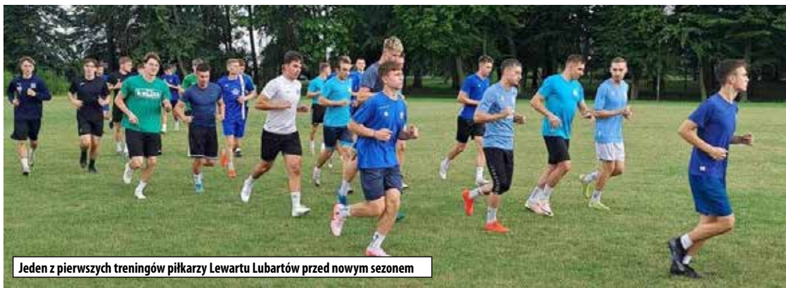
Jeden z pierwszych treningów piłkarzy Lewartu Lubartów przed nowym sezonem

III liga, grupa IV w sezonie 2024/2025 składała się będzie z 18 zespołów: Sandecja Nowy Sącz (spadkowicz z II ligi), Siarka Tarnobrzeg, Star Starachowice, Avia Świdnik, Wiślanie Jaśkowice, Pod-