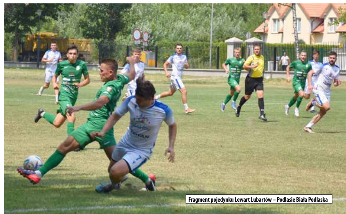
Fragment pojedynku Lewart Lubartów – Podlasie Biała Podlaska