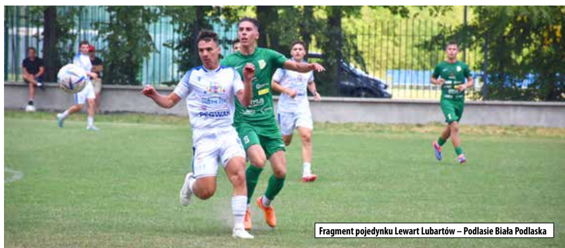
Fragment pojedynku Lewart Lubartów – Podlasie Biała Podlaska