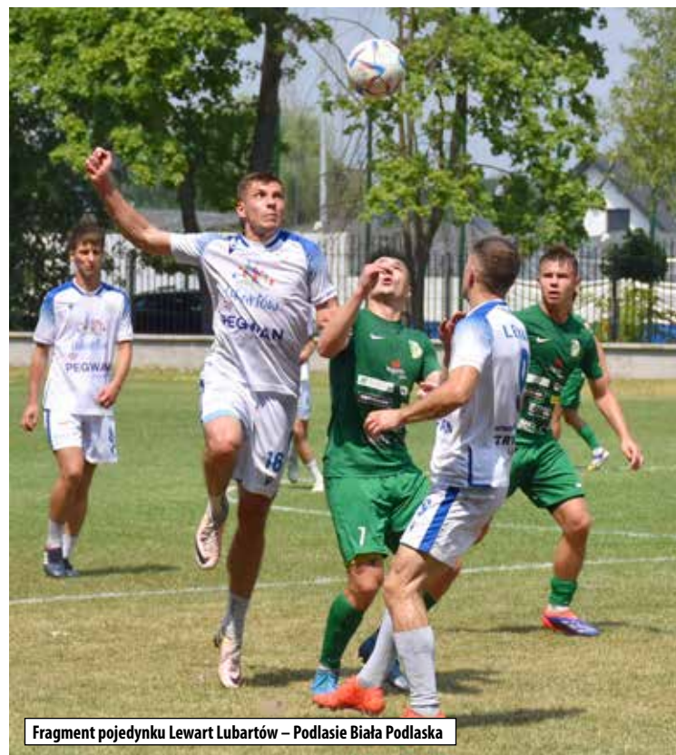
Fragment pojedynku Lewart Lubartów – Podlasie Biała Podlaska