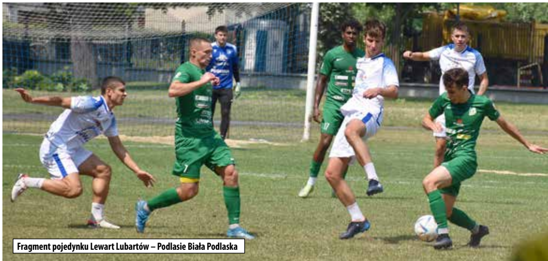
Fragment pojedynku Lewart Lubartów – Podlasie Biała Podlaska