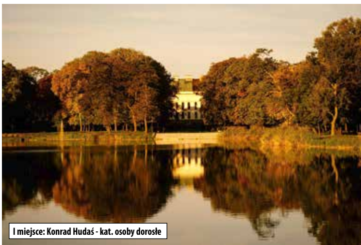
I miejsce: Konrad Hudaś - kat. osoby dorosłe