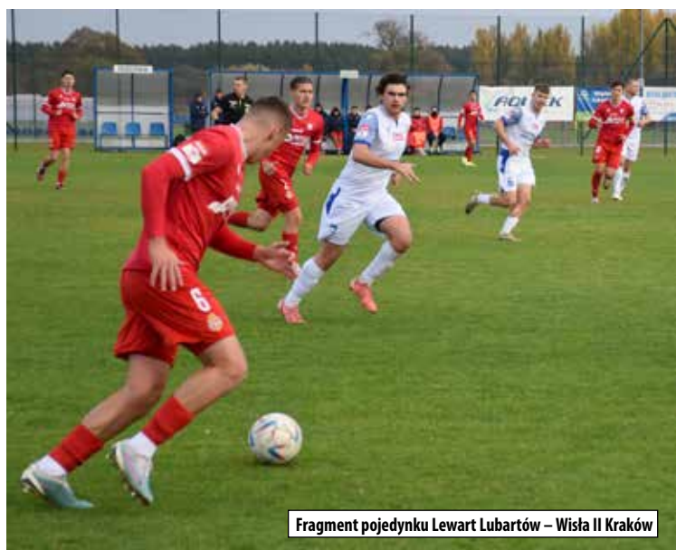
Fragment pojedynku Lewart Lubartów – Wisła II Kraków