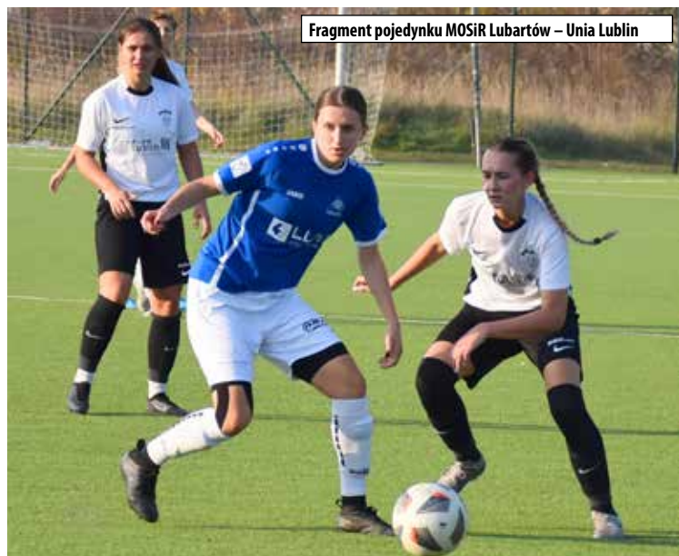
Fragment pojedynku MOSiR Lubartów – Unia Lublin