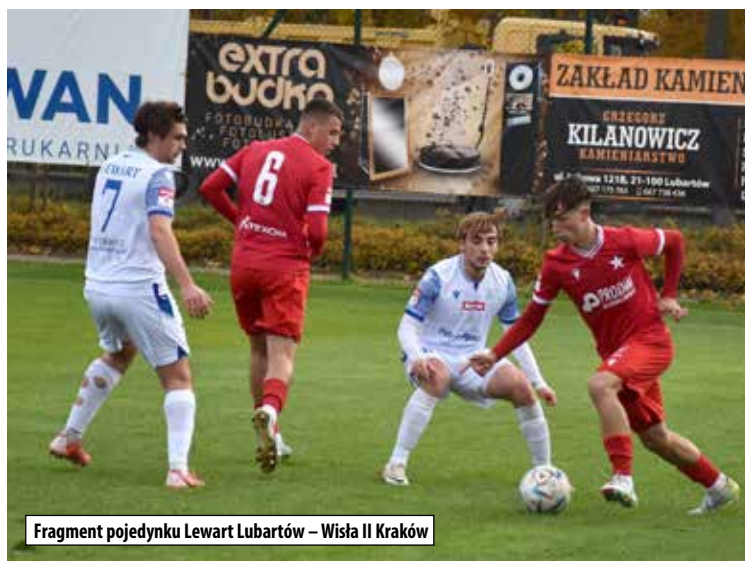
Fragment pojedynku Lewart Lubartów – Wisła II Kraków