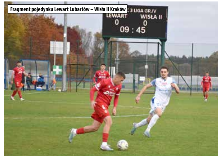
Fragment pojedynku Lewart Lubartów – Wisła II Kraków