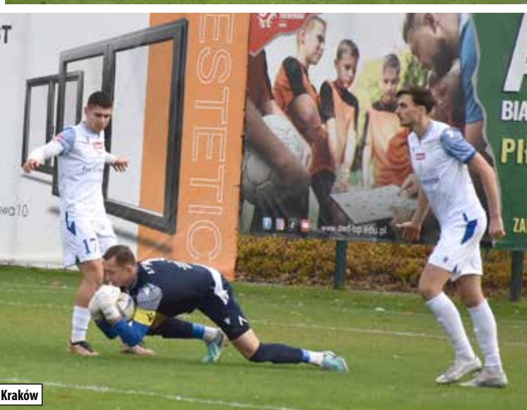
Fragment pojedynku Lewart Lubartów – Wisła II Kraków