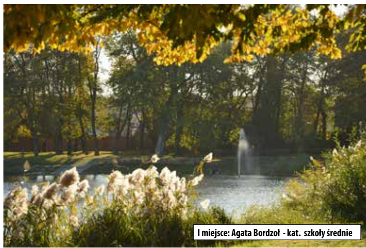
I miejsce: Agata Bordzoł - kat. szkoły średnie