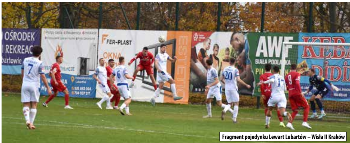
Fragment pojedynku Lewart Lubartów – Wisła II Kraków