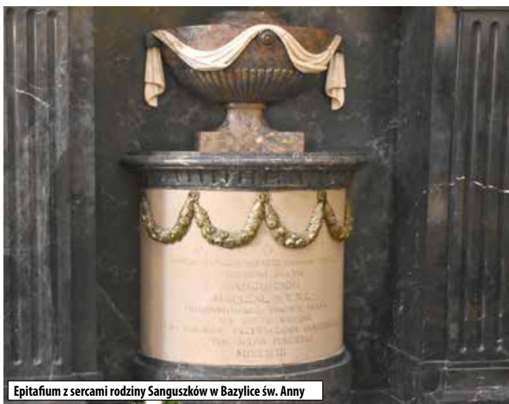
Epitafium z sercami rodziny Sanguszków w Bazylice św. Anny

Przed nami kolejny ważny dzień w historii Lubartowa: 22 listopada. Tego dnia w 1744 r. czyli 280 lat temu na prośbę księcia Pawła Karola Sanguszki król August III wydał dokument, który odnawiał prawo miejskie, a przede wszystkim potwierdzał nową nazwę miasta, czyli Lubartów i nadawał nowy herb – dwudzielny utrwalający rodziny: Firlejów XVI – wiecznych założycieli miasta (herb Lewart) oraz Sanguszków (herb Pogoń) – odnawiających miasto po zniszczeniach i upadku z XVII i początku XVIII wieku. Zarówno nazwa, jak i herb obowiązują do dzisiaj. W posiadanie dóbr lewartow-