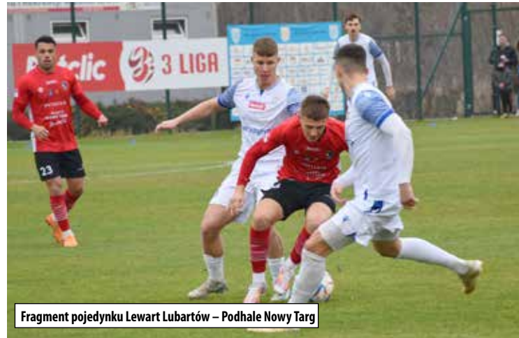
Fragment pojedynku Lewart Lubartów – Podhale Nowy Targ