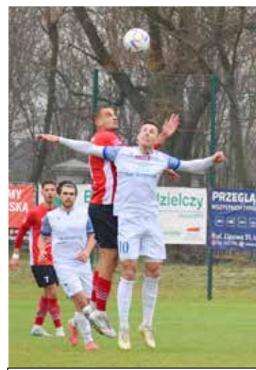
Fragment pojedynku Lewart Lubartów – Podhale Nowy Targ