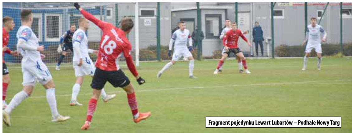
Fragment pojedynku Lewart Lubartów – Podhale Nowy Targ