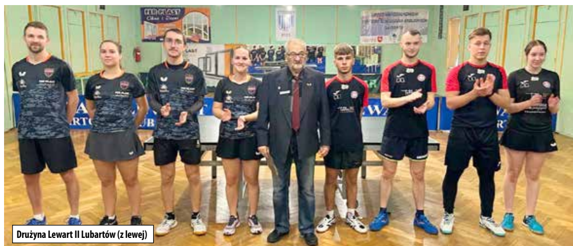
Drużyna Lewart II Lubartów (z lewej)

Po trzech kolejkach Lewart III zajmuje siódme miejsce w tabeli bez zdobyczy punktowej.