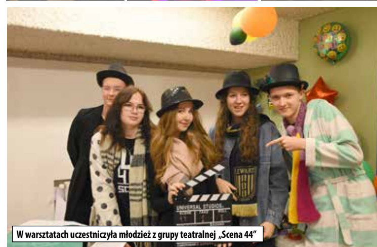
W warsztatach uczestniczyła młodzież z grupy teatralnej „Scena 44”

nicy zajęć tworzyli scenariusz, obsługiwali kamerę, bawili się słowem i światłem. Premiera filmów odbędzie się już za tydzień na gali finałowej Festiwalu "Lubartów 33", potem nagrania pojawią się w internecie. Przedsięwzięcie objęte jest wsparciem w ramach Kra-