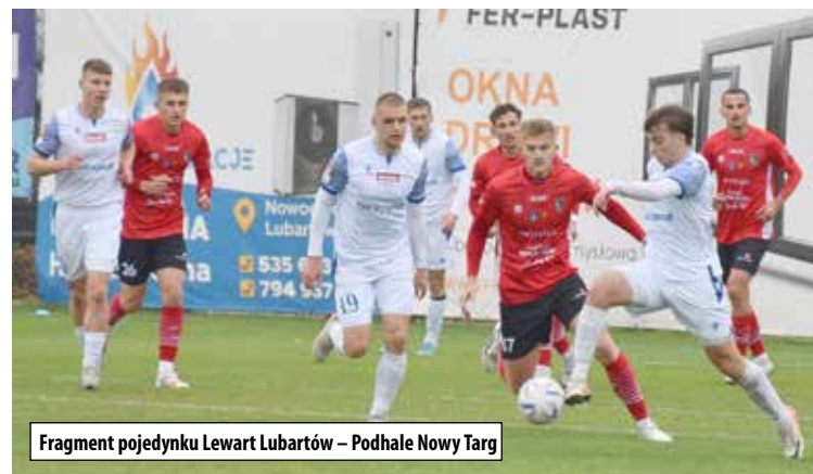
Fragment pojedynku Lewart Lubartów – Podhale Nowy Targ