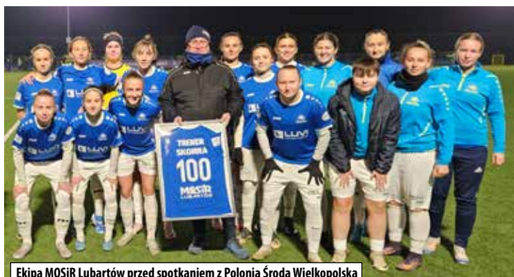
Kolektywne zdjęcie zespołu MOSiR Lubartów przed meczem z Polonią Środa Wielkopolska

ig, foto: Ireneusz Gózdź, Facebook Mosir Lubartów – Kobiety