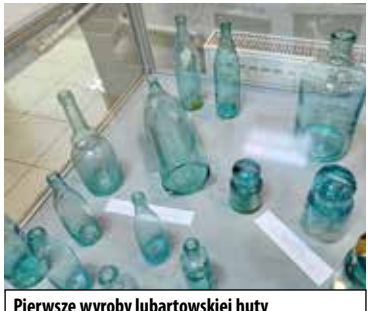
Pierwsze wyroby lubartowskiej huty