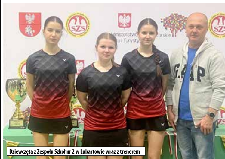
Dziewczęta z Zespołu Szkół nr 2 w Lubartowie wraz z trenerem