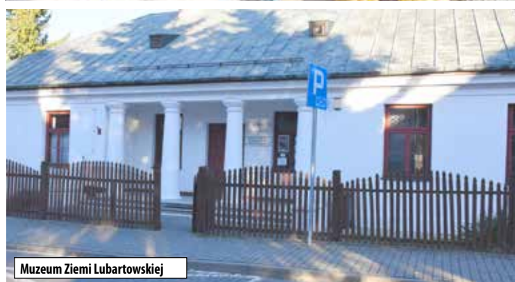
Muzeum Ziemi Lubartowskiej