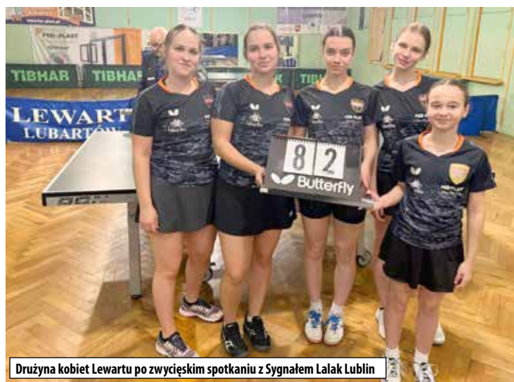
Drużyna kobiet Lewartu po zwycięskim spotkaniu z Sygnałem Lalak Lublin