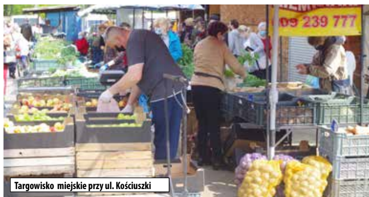
Targowisko miejskie przy ul. Kościuszki

Jak zauważył, dochody miasta wzrosły o 28% w porównaniu z rokiem 2024, co świadczy o sku-