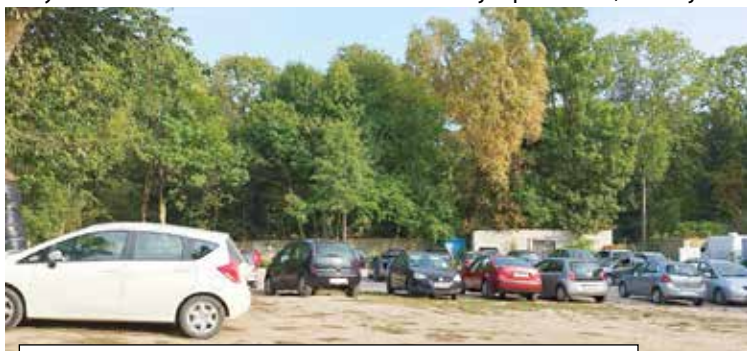
Tu powstanie nowoczesny parking. W dni targowe będzie tu możliwość sprzedaży z aut