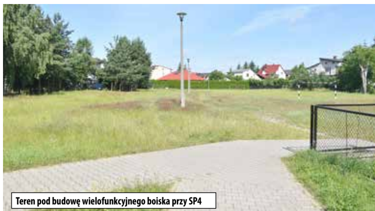
Teren pod budowę wielofunkcyjnego boiska przy SP4

Trwająca od lipca 2024 roku przebudowa kluczowych ulic w mieście – 3 Maja, Parkowej i Chopina – jest już bliska zakończenia. Prace przy przebudowie są zrealizowane już w 90 procentach, a mieszkańcy mogą korzystać z odnowionych odcinków.